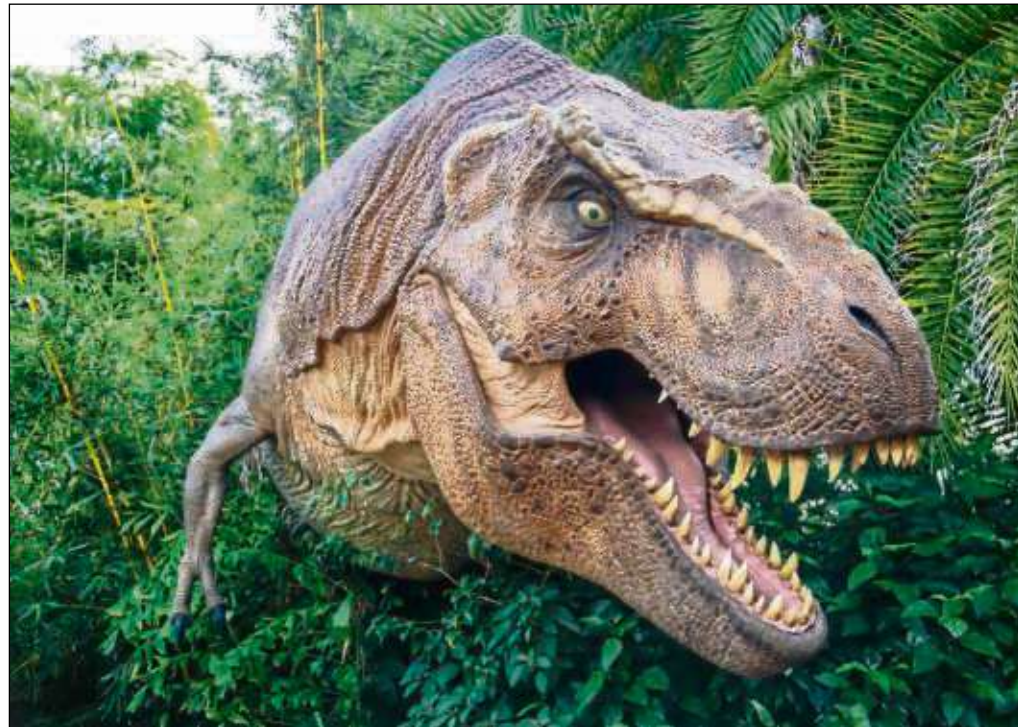
Achtung: Ein T-Rex trampelt durch Offenbach.

Ur-Echsen erwachen mit Hilfe elektronischer High-Tech in der neuen, familienfreundlichen Dinosaurier-Show vor den Augen des Publikums zum Leben. Computergesteuerte elektronische, lebensechte animierte Dino-Figuren und menschliche Darsteller vermitteln anschaulich die Dinosaurier-Geschichte auf der Erde. Details und Erklärungen zu Leben, Ernährung und Jagen der Dinosaurier liefert ein Paläontologe, der als Moderator durch die Live-Show aus Spezialeffekten, Spannung und Entertainment führt. Wissenschaftliche Erkenntnisse über die Zeit der Ur-Echsen werden so anschaulich und unterhaltsam vermittelt.